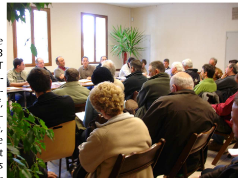
Assemblée Générale ASA Haute Crau du 4 avril 2007

En somme les Statuts et règlements de fonctionnement mis en place à l'issue de la démarche seront traités de manière secondaire de la part des adhérents de l'Association. Ceux-ci seront en effet en demande d'un service donné pour un tarif donné et ne valideront les documents administratifs de l'ASA que sur cette base. Ces deux éléments essentiels seront donc au cœur de cette phase de travail.