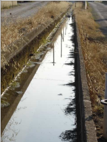
Le Canal, Chemin de Fallet

Un seul objectif : repartir sur des bases fiabiles et saines